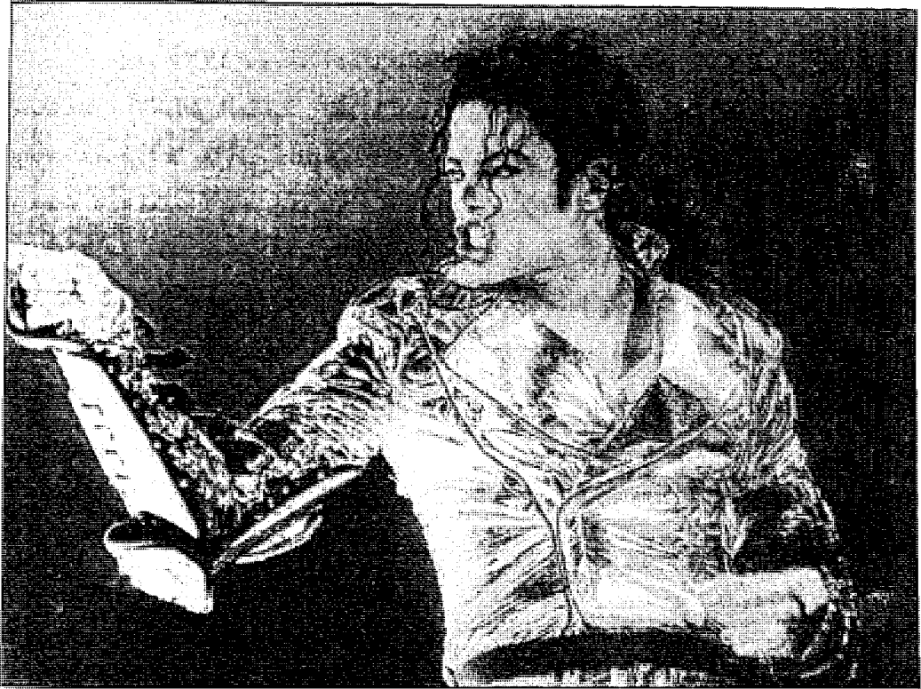
مايكل جاكسون .. أحد وسائل اختراق شبابنا تحت شعار الفن والموسيقى